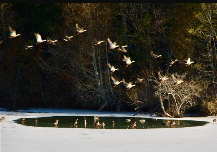
第 28 回 美星の四季写真コンテスト 入賞作品